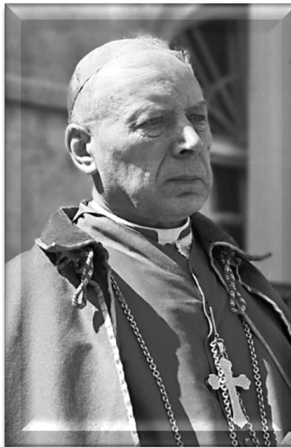
Prymas Polski, kard. Stefan Wyszyński.

W 2021 r. przypada 40. rocznica śmierci, a także 120. urodzin duchownego. Stefan Wyszyński był głosicielem uniwersalnych wartości chrześcijańskich i mężem stanu. Występował w imieniu Ojczyzny, domagając się od komunistycznych władz poszanowania wolności religijnej i broniąc polskiej kultury. Każdym słowem podkreślał konieczność zrozumienia znaczenia wolności Narodu, która dla każdego obywatela winna być wielkim dobrem i rzeczywistą własnością. „Wolność Narodu była dla Prymasa Tysiąclecia priorytetem działalności kapłańskiej i społecznej” (z Uchwały Sejmu RP z 27 listopada 2020 r.)