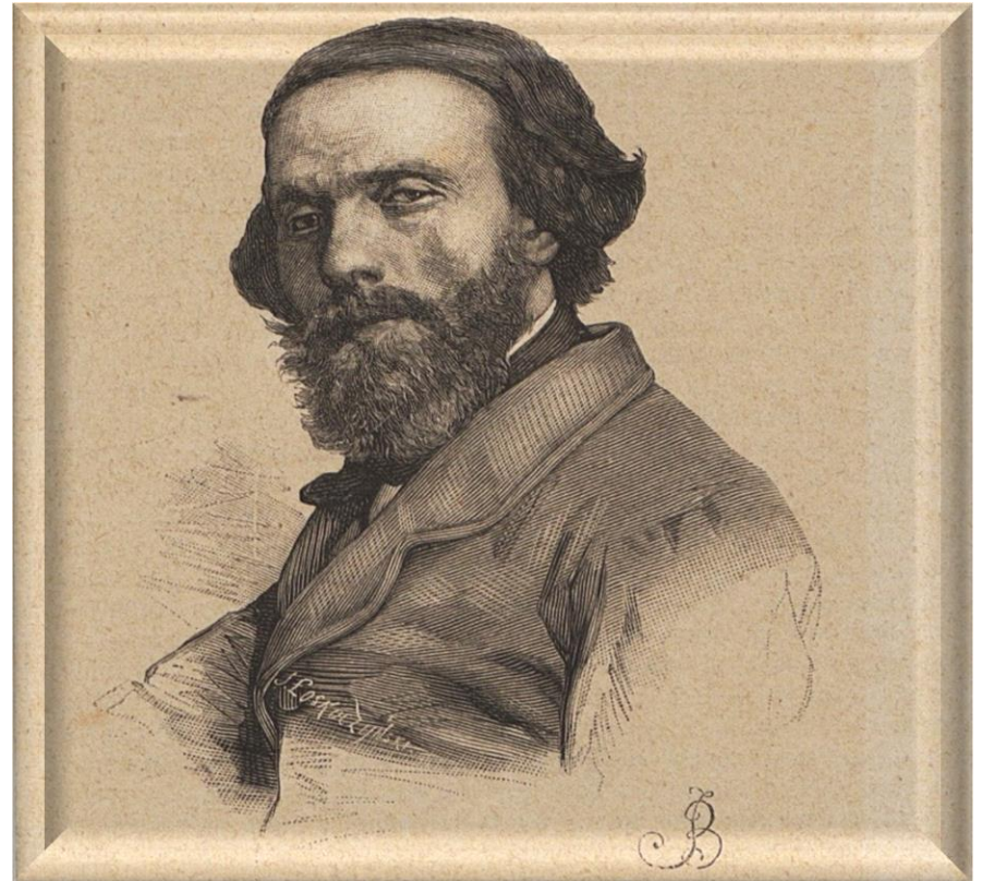
Cyprian Kamil Norwid

(z Uchwały Sejmu RP z 27 listopada 2020 r.)